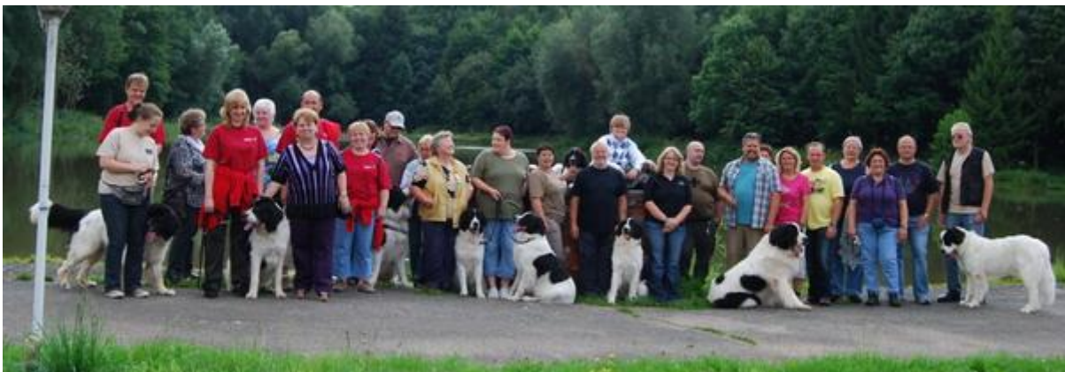
Kurz vor unserer Wiederankunft am Hotel wurden wir noch mit Kaffee und leckerem Kuchen erwartet.

Dort angekommen wurde zunächst die erweiterte Vorstandssitzung abgehalten. Anschließend stärkten sich einige bei einem deftigen Mittagessen, um dann die von Herrn Stripling geführte Wanderung anzutreten. Hier ging es bei strahlendem Sonnenschein durch den angrenzenden Wald, so dass auch die mitgereisten Hunde zu ihrem Recht kamen.